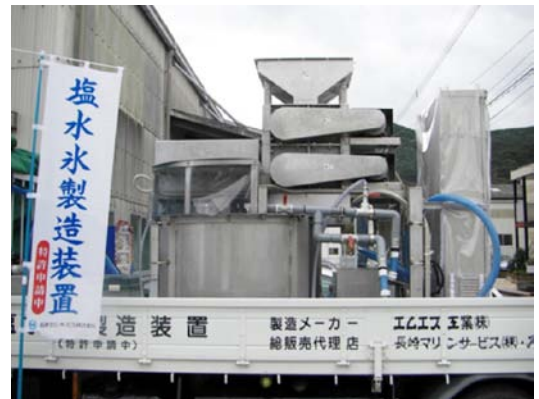
塩水氷製造装置デモ機