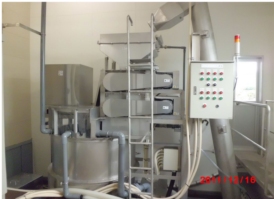
塩水氷製造装置 本体